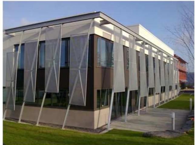
Au sud les apports sont captés et gérés

Le socle du bâtiment, rassemblant les parties pleines et allèges du rez-de-chaussée, est constitué de maçonnerie de bloc béton cellulaire enduits. Les menuiseries sont en