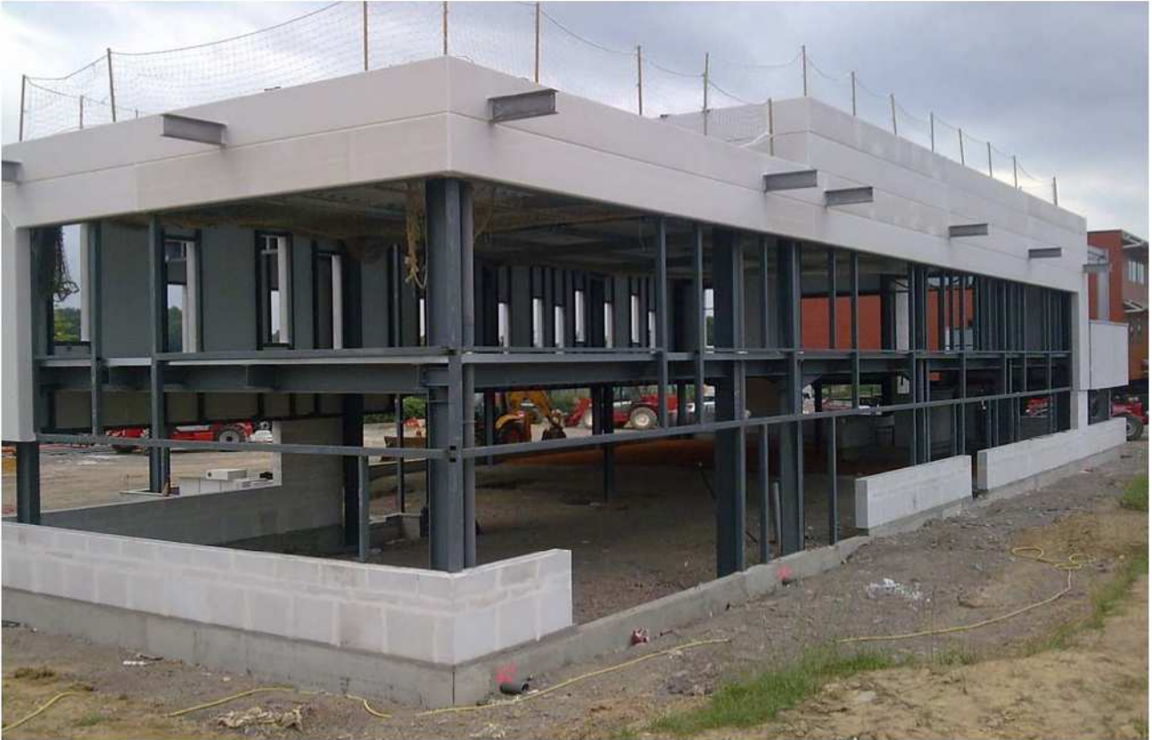
La conception poteaux poutres diminue les délais et incidences environnementales

L'ossature du projet est en acier de type "poteaux-poutres". Les façades forment donc un habillage qui varie selon les orientations. Néanmoins, les matériaux utilisés sont limités afin de préserver une image simple et harmonieuse de l'ensemble. Les éléments pleins sont essentiellement constitués de panneaux de béton cellulaire (XELLA) peint en gris clair associés à une isolation thermique ultra performante, permettant de réduire considérablement les dépenses en énergie.