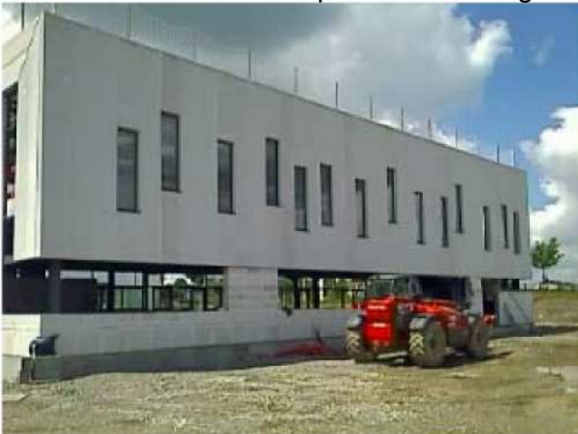
Au nord une façade plus isolée

L'ossature du projet est en acier de type "poteaux-poutres". Les façades forment donc un habillage qui varie selon les orientations. Néanmoins, les matériaux utilisés sont limités afin de préserver une image simple et harmonieuse de l'ensemble. Les éléments pleins sont essentiellement constitués de panneaux de béton cellulaire (XELLA) peint en gris clair associés à une isolation thermique ultra performante, permettant de réduire considérablement les dépenses en énergie.